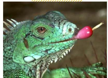
“Ook vruchten van de bolcactus lusten leguanen graag”