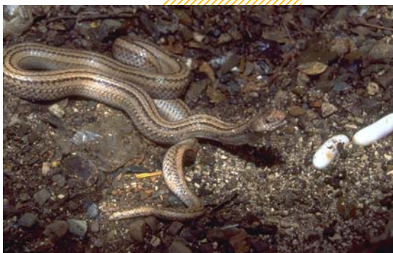
“Kolebra ta reprodusi pa medio di pone webu...”