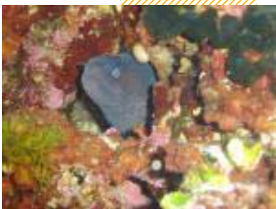
“Un Murea, mihó konosi na Papiamentu komo kolebra di laman...”

di nan hòl nan ta ataka. E piskánan aki ta yag anochi riba nan kuminda. Maske nan mordé no ta venenoso e por kousa heridanan mahos. E 'Green Murea' ta konosí pa e forsa inmenso ku e tin. Piskadónan ku ta piska ku harpun por konta kon ora ku nan a purba di piska e bestia aki i nan harpun a desviá djis un tiki, e bestia aki a lora na dje i dobl'é manera ta papel un hende ta dobla. Por sierto, piskamentu ku harpun ta sumamente prohibí.